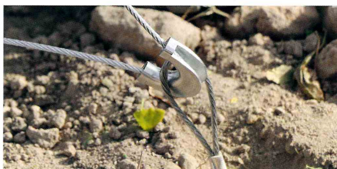
Sotto: protezione fune